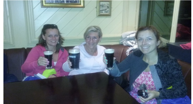
IRISH PUB - SZANTY