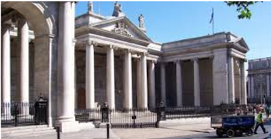
BANK OF IRELAND