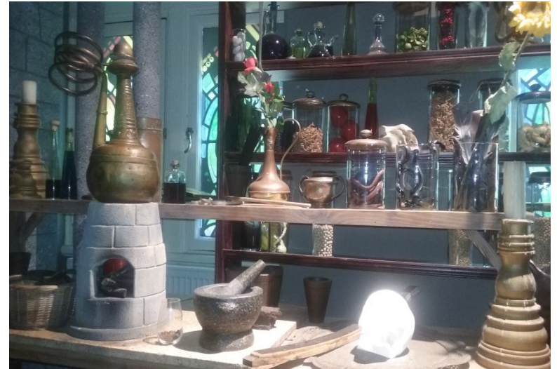
IRISH WHISKEY MUSEUM