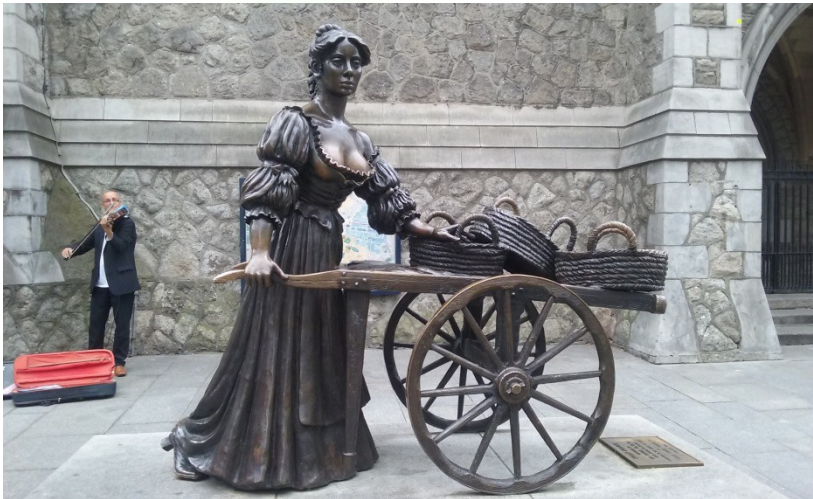
MOLLY MALONE STATUE