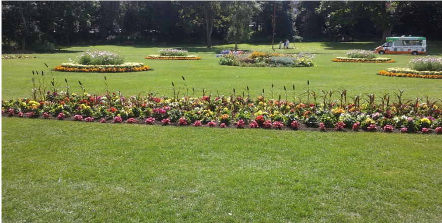
ST. STEPHEN'S GREEN PARK